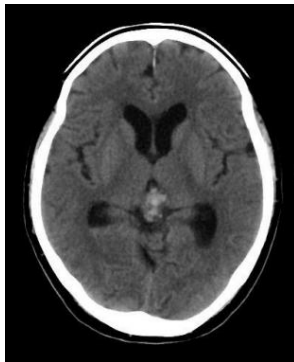
頭部撮影 息止め不要